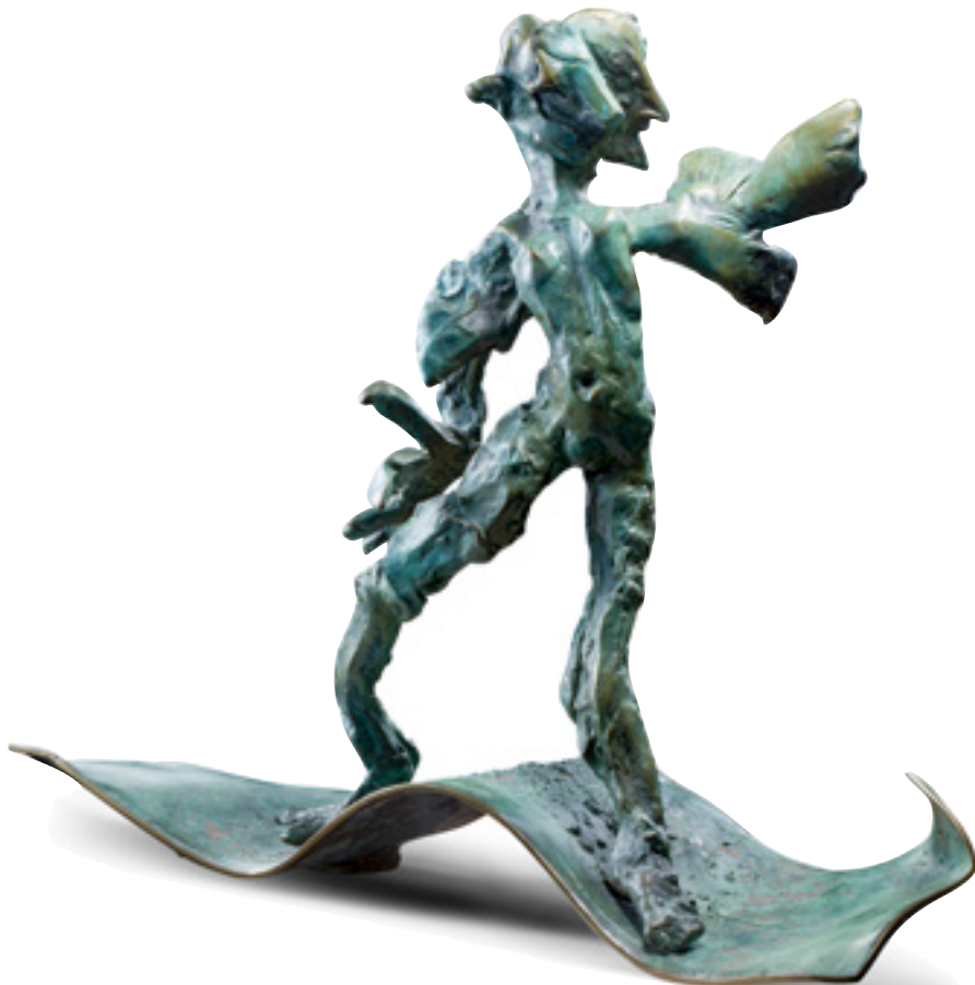
CATHY CARMAN Ierland MASQUERADE (1992) Bronzen 45 cm